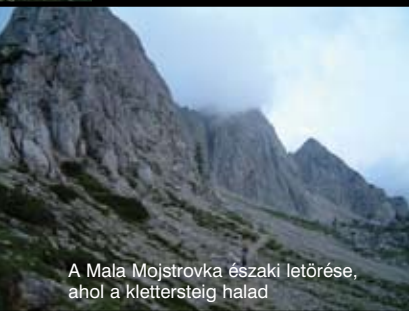
A Mala Mojstrovka északi letörése, ahol a klettersteig halad

A Vršič-hágó másik, nyugati oldalán a Prisanknál kissé alacsonyabb, tömzsi mészkőtömb emelkedik. Északi falának rövid klettersteigje B, C nehézségű, kiválóan alkalmas kezdők számára a biztosított utak megismerésére, a klettersteigen való közlekedés, biztosítás gyakorlására. No nem gyerekték azért ez az út, érdekesebb először tapasztaltabbak kíséretében nekivágni, és mindenképp szükséges a klettersteigszett, a sisak és a szédülésmentesség! A hágóból hatalmas kögörgeteg látványa ijeszti el a kevésbé merészeket, ám ez a lemeneti út.