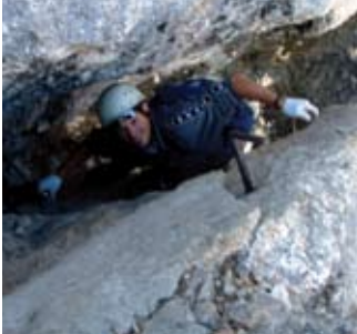
A Kopiš arjeva út szűk kéményében

Mindjárt a beszállást követően az egyik legnehezebb rész következik. Keskeny peremen harántolás, kitett áthajlás, majd függőleges mászás jó tíz-tizenöt méteren át. Ezt követően hosszan kapaszkodunk föl egy széles kuloár oldalfalán, néha a gerincen. Újabb nehéz mászószakasz következik egy hatalmas, ferdén emelkedő repe- désben, néha szinte barlangi körülmények között csúszva-mászva a sikos sziklán, máskor meredek