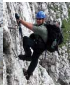
Egy rövid D nehézségű szakasz