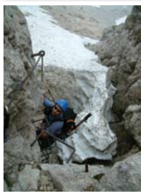
Klettersteig a Júliai-Alpokban

A mászás nem túl nehéz, de egyre mélyülő szakadék fölött vezet, kitett peremeken, omladékos sziklákon. Kezdő mászók kiválóan megtapasztalhatják itt a klettersteig alapjait, a sziklafal tapintását, a karabinerek csatolásának ritmusát, a nagy mélységek fölötti mozgás élményét. Följebb az ösvény meredeksége csökken, és egy barázdált felszínű előcsúcsra jutunk. További félórás kapaszkodással érjük el a csúcst. A lefelé vezető út sokkal könnyebb a déli oldal szikláin, majd a parkolóból is látható kőtörmeléklejtőn keresztül vezet vissza a hágóba.