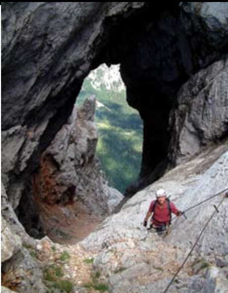
Kimászás a Prednje okno gigantikus üregéből

Legelőször felülről tévedtem bele, éjszaka, épp elég volt zseblámpafényben levergődni. A kíván- csiség már a következő évben visszahajtott. Ekkor félúton hatalmas eső kapott el, vissza kellett vonulni, a beszállás fölötti falon vizes és alakult ki, a zuhatagban kellett leereszkedni. A következő évben a még júniusban is méteres hó és jég késztetett meghátrálásra. Végül persze sikerült és igazán remek élmény volt.