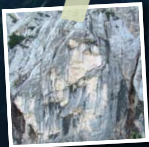
A híres kőleány, az Ajdosa Deklica „arca” a Kopiš arjeva útról