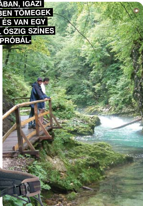
A Vintgar-szurdok bárki számára elérhető

A Júliai-Alpokban nem ez a helyzet: itt szinte minden biztosított út csúcsközelben van, ahova jelentős, több száz, de gyakrabban ezer méter körüli szintkülönbség legyőzésével juthatunk el. Azaz ebben a hegységben komplex magashegyi túrákra kell felkészülnünk, jó kondíciót igénylő gyaloglással, akár nyáron is havas viszonyokkal és persze biztosított mászással.